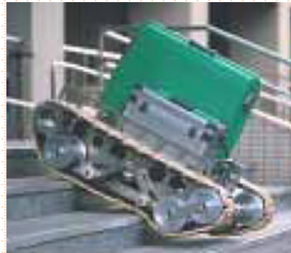
自由に変形するキャタピラで移動 (XEVIUS)

ご興味のある方、参加を希望される方には、当日の集合場所等、見学詳細をコラボ産学官事務局より御連絡させていただきます。(参加費無料)